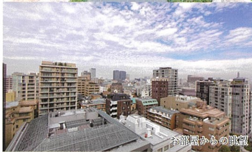
お部屋からの眺望