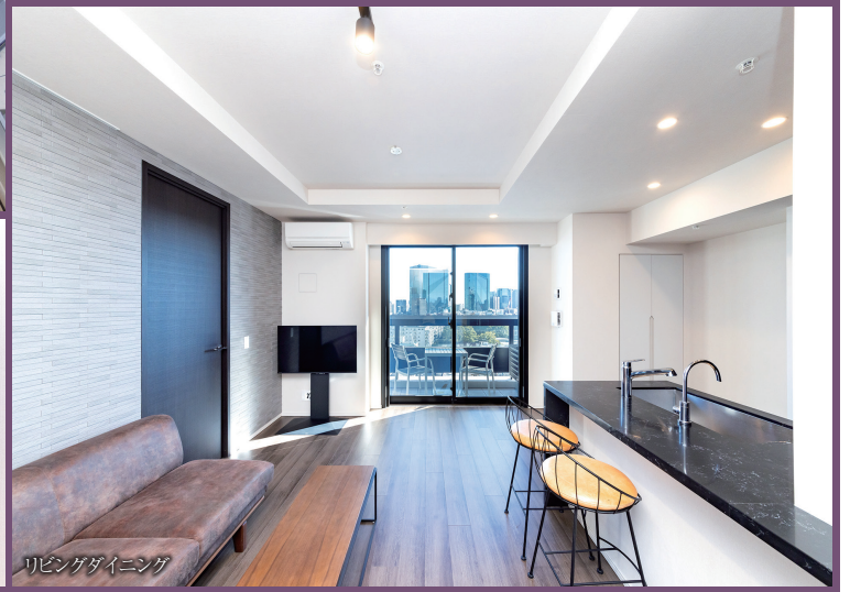
リビングダイニング