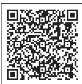
物件詳細はこちらから