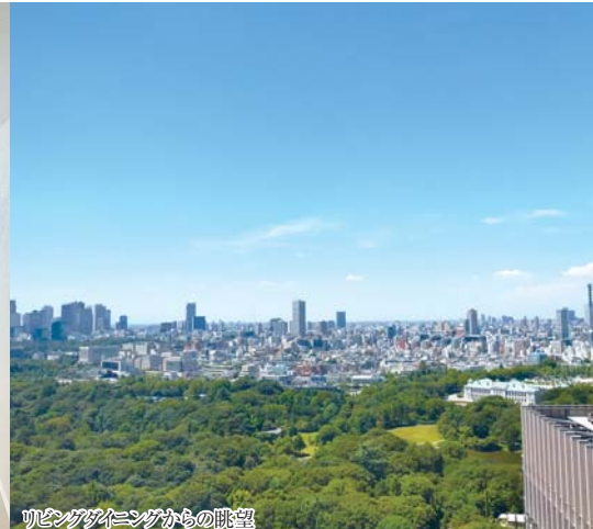
リビングダイニングからの眺望